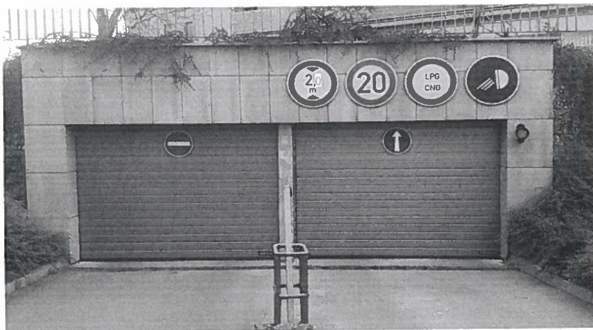
ilustrační foto ALTOMA - vrata SPU F 42 - stucco drážky